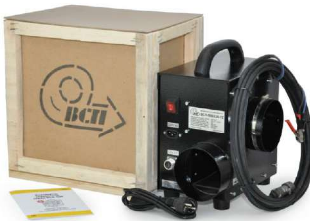
Рис. 3.1 Общий вид