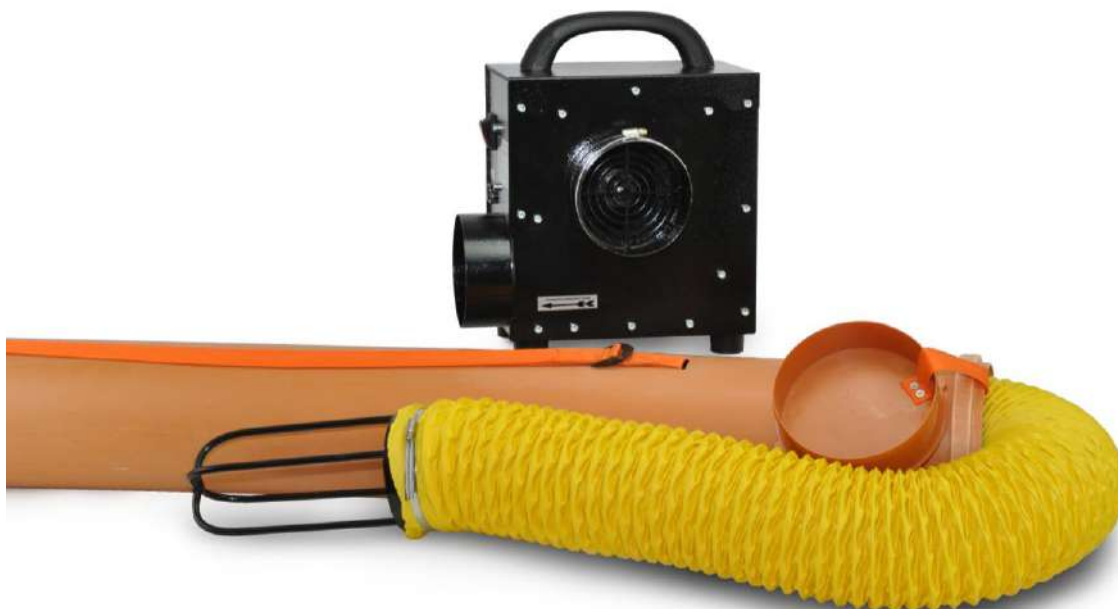
Рис. 12.8 Защитный кейс воздуховода

Защитный кейс воздуховода предназначен для его хранения и транспортировки, что значительно продлевает его срок эксплуатации. Кейс имеет удобную плечевую лямку с регулировкой. Конструкция подставки-треноги и кейса для воздуховода выполнены так, что подставка-тренога и воздуховод могут совместно храниться и транспортироваться в кейсе для воздуховода.