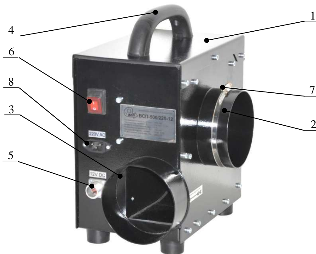
Рис. 4.1. Общий вид вентилятора (на примере модели ВСП-500/220-12)