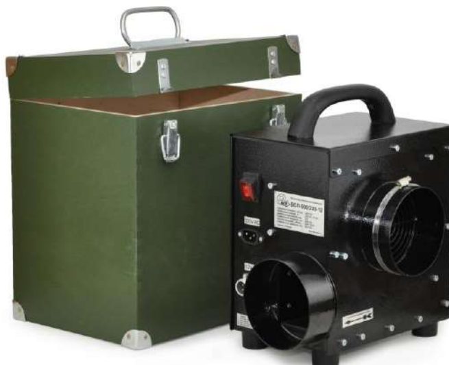
Рис. 12.7 Защитный кейс вентилятора

Защитный кейс, имеющий надёжную вандалостойкую конструкцию по армейскому образцу, предназначен для хранения и транспортировки изделия, что продлевает срок эксплуатации вентилятора. Кейс можно также использовать в качестве подставки для вентилятора. Для удобства транспортировки кейс снабжён складной ручкой.