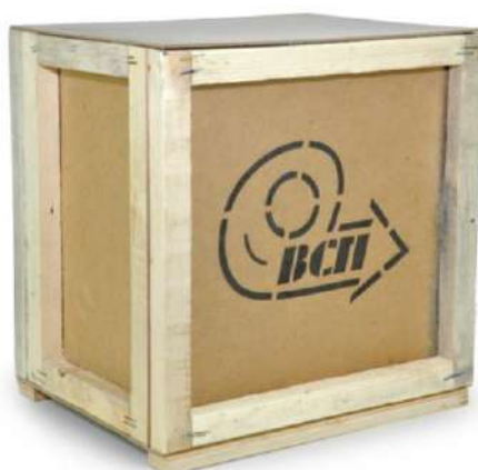
Рис. 11.1. Общий вид упаковки

* - фактическая масса брутто может отличаться от указанной в пределах 0,5 кг.